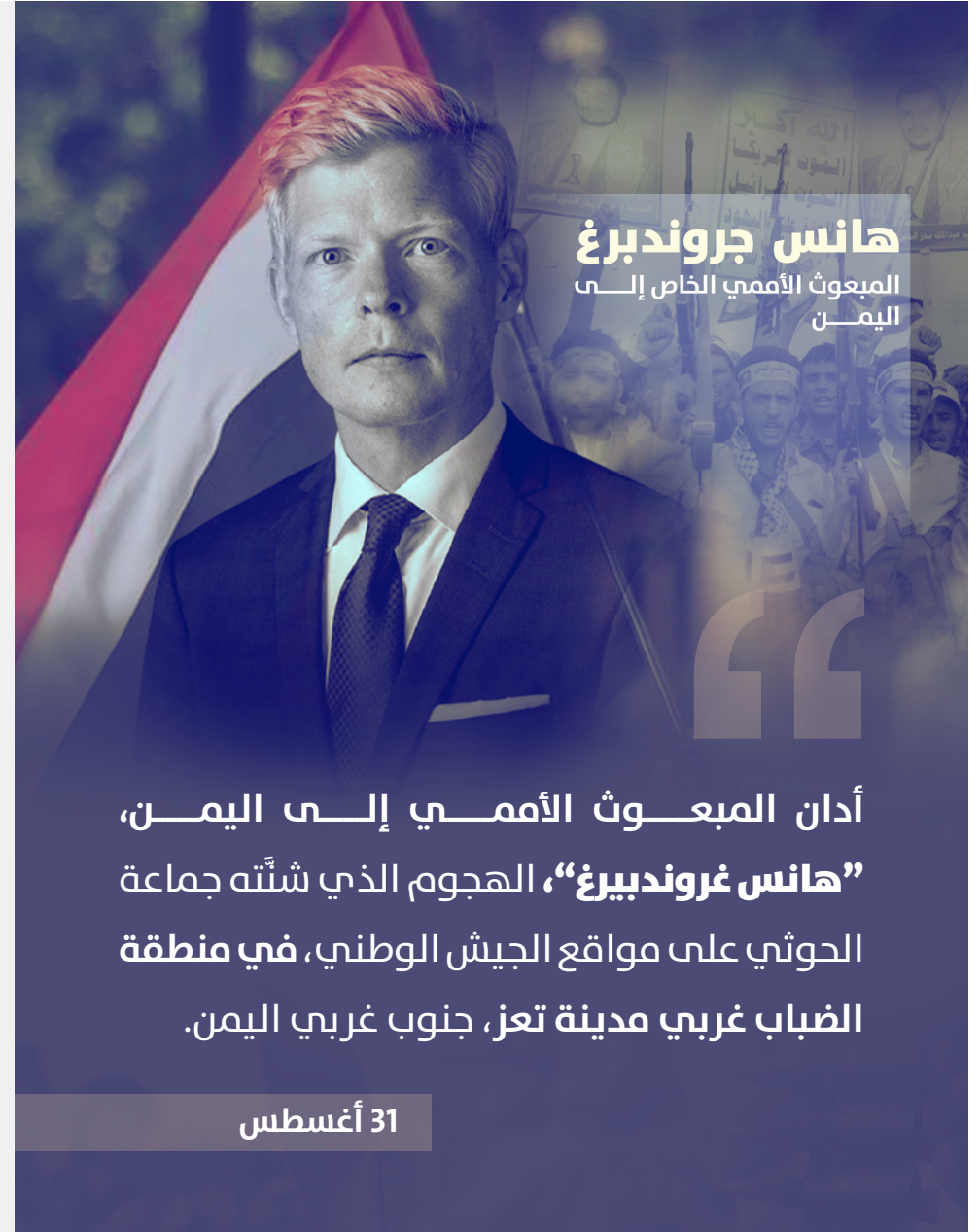
هانس جرونديبرغ المبعوث الأممي الخاص إلى اليمن

دعا المبعوث الأمريكي الخاص إلى اليمن، "تيم ليندركينغ"، جماعة الحوثي إلى الانخراط بجدية في جهود إحلال السلام، ووقف الهجمات العسكرية على مدينة تعز، مع التأكيد على دعم إقليمي والتزام أممي بالهدنة، وسعي إلى تقويتها وتمديدتها لتصبح سلافاً دائماً.