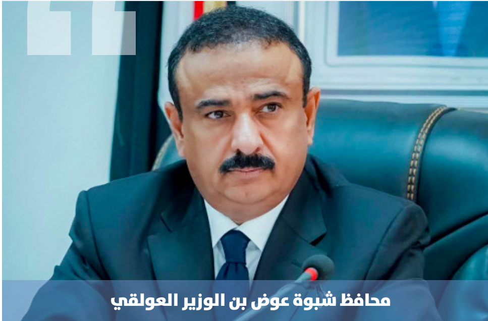
محافظ شبوة عوض بن الوزير العولقي

أعلن محافظ شبوة، عوض بن الوزير العولقي، إقالة قائد قوات الأمن الخاصة بالمحافظة، العميد عبدربه لعكب، واثنين من قيادات قوات الأمن الخاصة، دون التشاور مع الحكومة؛ فيما وصف وزير الداخلية القرار بالمخالف للقانون.