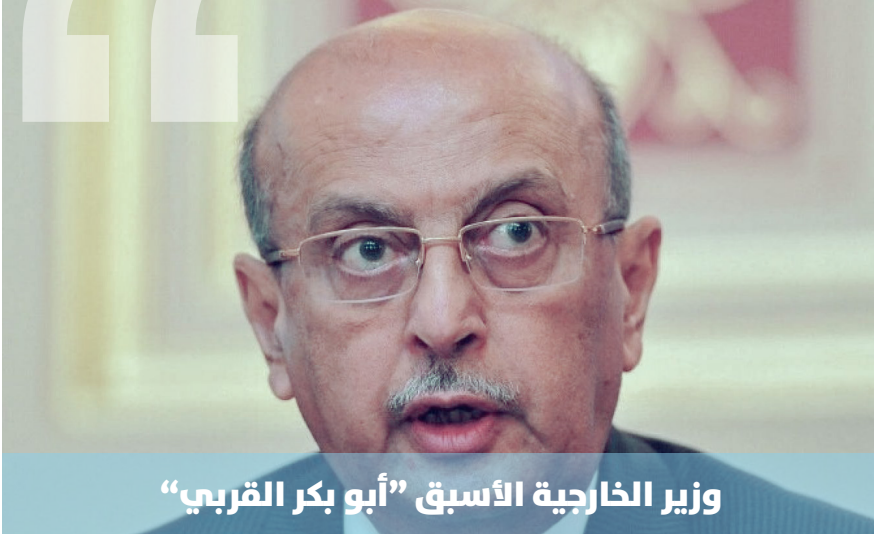
وزير الخارجية الأسبق "أبو بكر القربي"

قال وزير الخارجية الأسبق، والقيادي في حزب المؤتمر الشعبي العام، الدكتور أبوبكر القربي: إنّ الأحداث الأخيرة في شبوة هي نتاج تحرّك فرنسي نشط، وتفاوض مع دول الإقليم (السعودية والإمارات)، وأطراف يمنية، لتصدير الغاز من منشأة بلحاف للغاز الطبيعي المسال، في ظلّ ارتفاع أسعار الغاز دوليًا، ولتخفيف الضّغط الرّوسني على أوروبا.