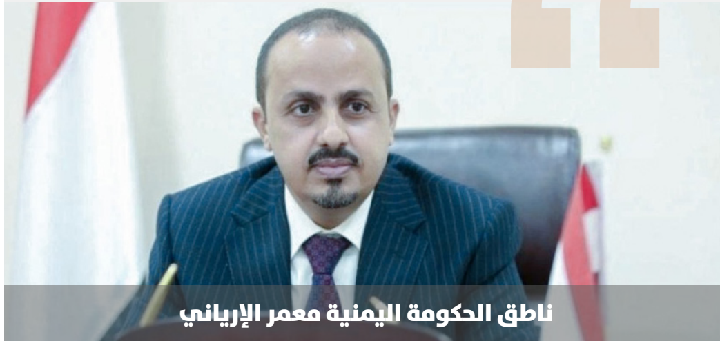
ناطق الحكومة اليمنية معمر الإرياني