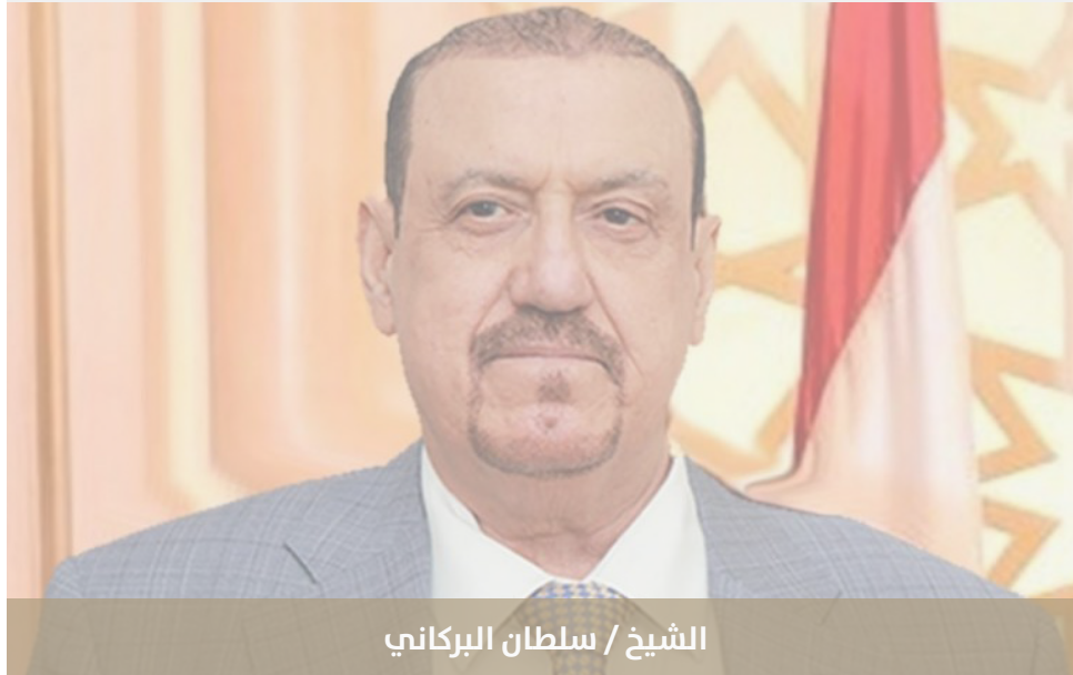
الشيخ / سلطان البركاني

أطلق رئيس مجلس النواب اليمني، سلطان البركاني، تصريحات، وُصفت بالقوية وغير المسبوق، رداً على بيان مجلس التعاون لدول الخليج العربية الداعي لإيجاد حل سياسي ينهي الحرب في اليمن؛ واصفاً الحوثيين بأنه أبعد ما يكون عن الحل السياسي، مذكراً دول الخليج بأن اليمن بالنسبة لإيران ليست سوى منطقة عبور، وأن الهدف الإيراني هو السعودية ودول الخليج.