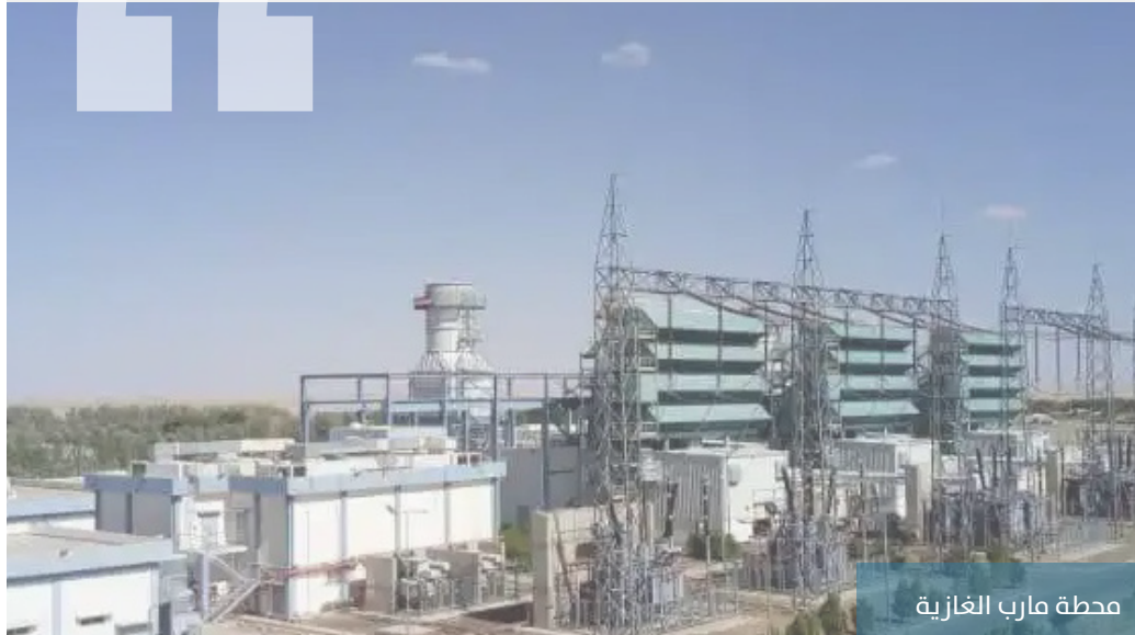
محطة مارب الغازية

فرضت جماعة الحوثي جرعة سعرية جديدة لمادة الغاز المنزلي، بمقدار (500) ريال يمني، في الأسطوانة الواحدة، ليرتفع سعرها من (6000) إلى (6500) ريال يمني، وتوزع عبر عقال الحارات، فيما يتم شراء الإسطوانة الواحدة من شركة صافر الغازية في مدينة مأرب بسعر (3500) ريال يمني.