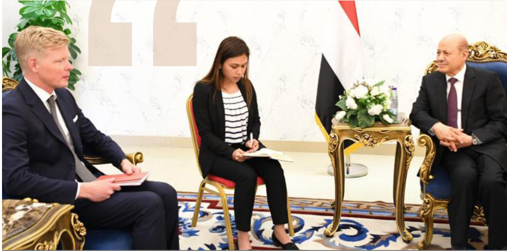
لقاء رئيس "مجلس القيادة الرئاسي"، د. رشاد العليمي، المبعوث الأممي إلى اليمن، "هانس جرونديبرغ"، في العاصمة السعودية الرياض

التقى رئيس "مجلس القيادة الرئاسي"، د. رشاد العليمي، المبعوث الأممي إلى اليمن، "هانس جرونديبرغ"، في العاصمة السعودية الرياض، مؤكداً بأن الانتقال إلى أي ملفات أخرى سيكون بعد إلزام جماعة الحوثي بفتح طرق تعز الرئيسية.