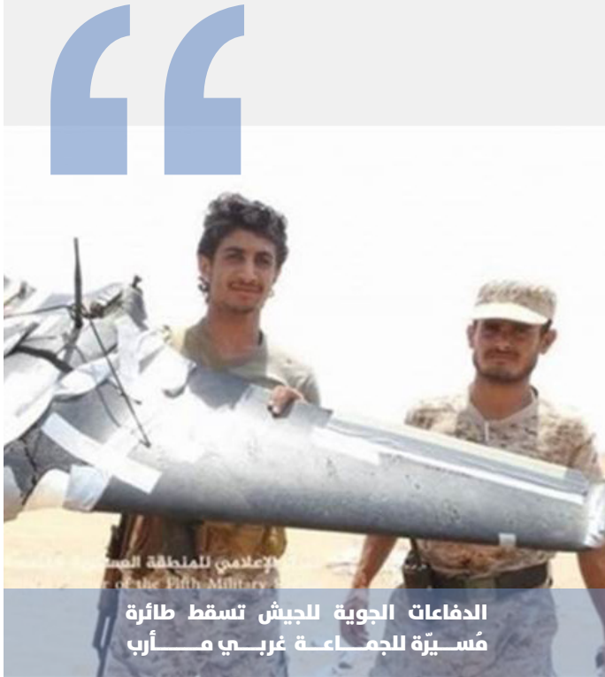
الدفاعات الجوية للجيش تسقط طائرة مُسيّرة لجماعة غربي مأرب

صدّ الجيش الوطني عملية تسلّل نفذتها جماعة الحوثي على مواقعه، شرقي مدينة تعز، ضمن خروقات مستمرّة للهُدنة.